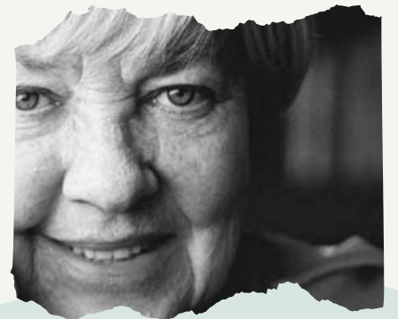
MARIA ELENA WALSH

En una cajita de fósforos se pueden guardar muchas cosas. Las cosas no tienen mamá.